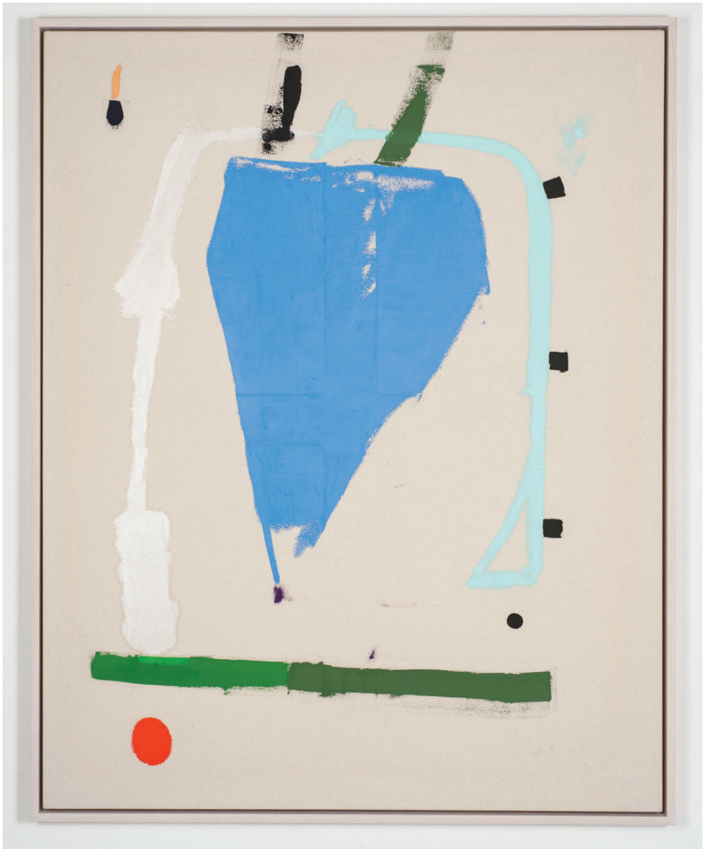
Mason Saltarrelli Summer in Honey Island, 2019 Oil on canvas 118,2 x 95,2 cm (framed)