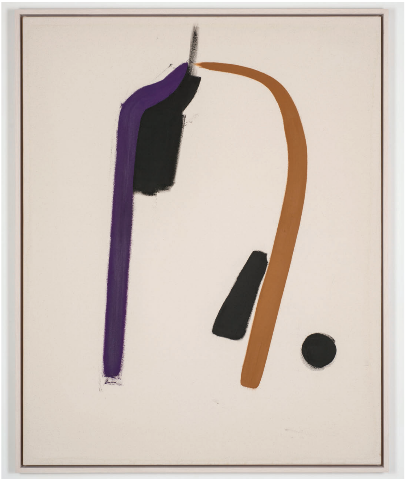
Mason Saltarrelli Possible path, possible portrait, 2019 Oil on canvas 118,2 x 95,2 cm (framed)