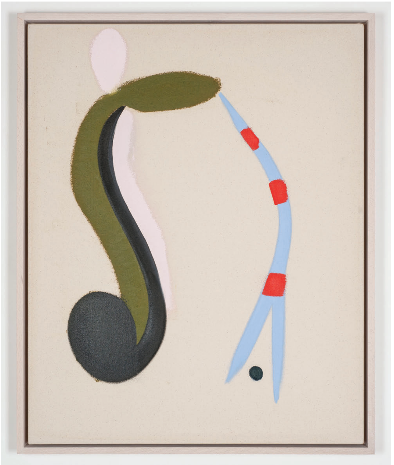
Mason Saltarrelli Tivoli, 2019 Oil on canvas 80 x 65 cm (framed)