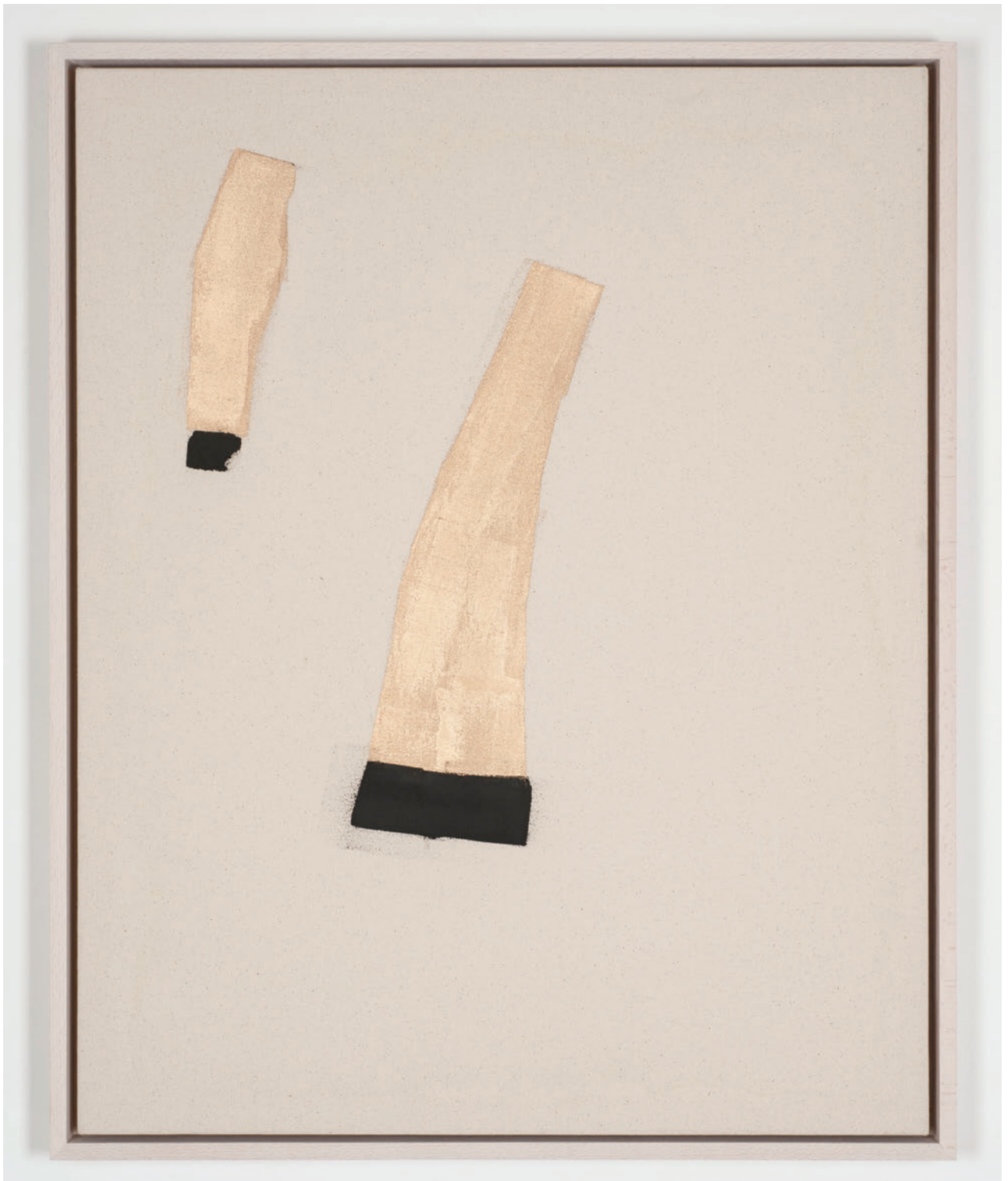
Mason Saltarrelli A shepherd and his barking dog , 2019 Oil on canvas 80 x 65 cm (framed)