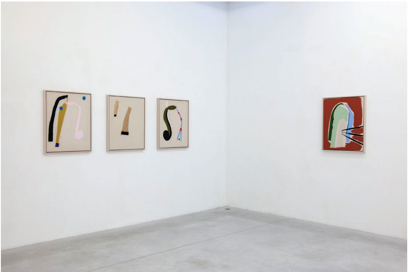
Exhibition view, Four Seasons In One Day , Meessen De Clercq, 2019