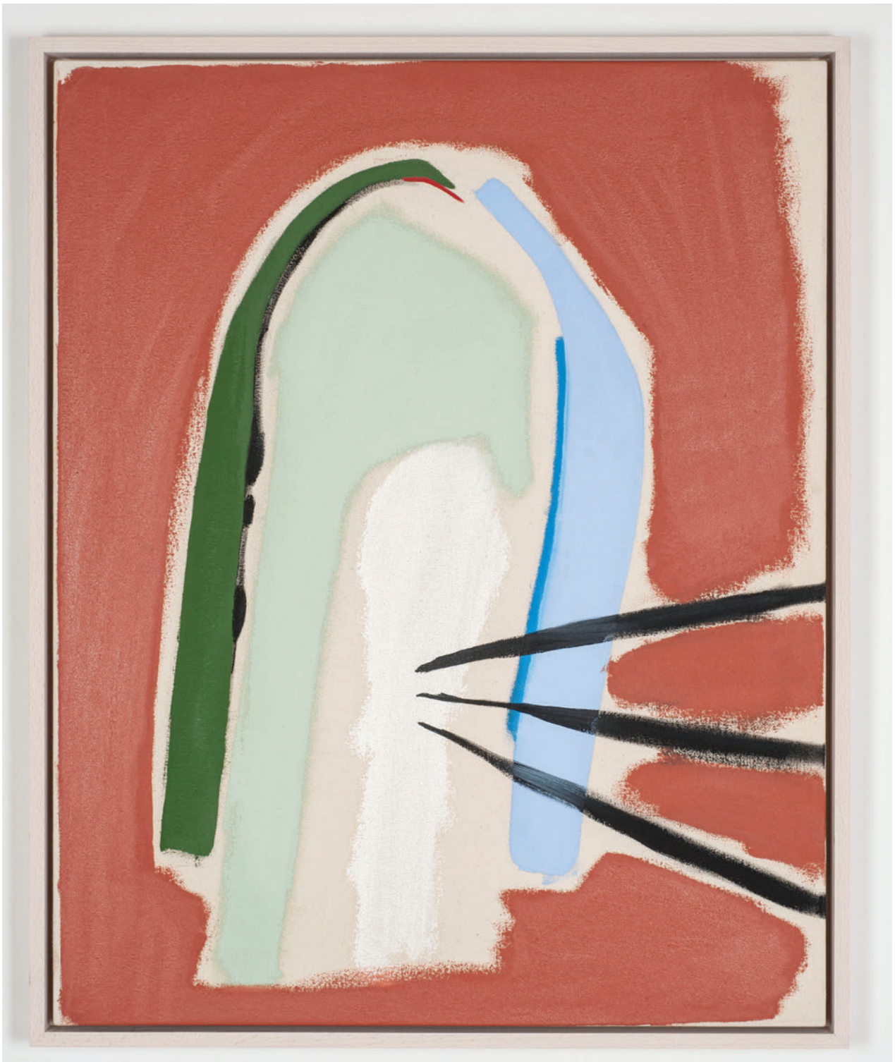
Mason Saltarrelli Varying aspects of a storm , 2019 Oil on canvas 80 x 65 cm (framed)