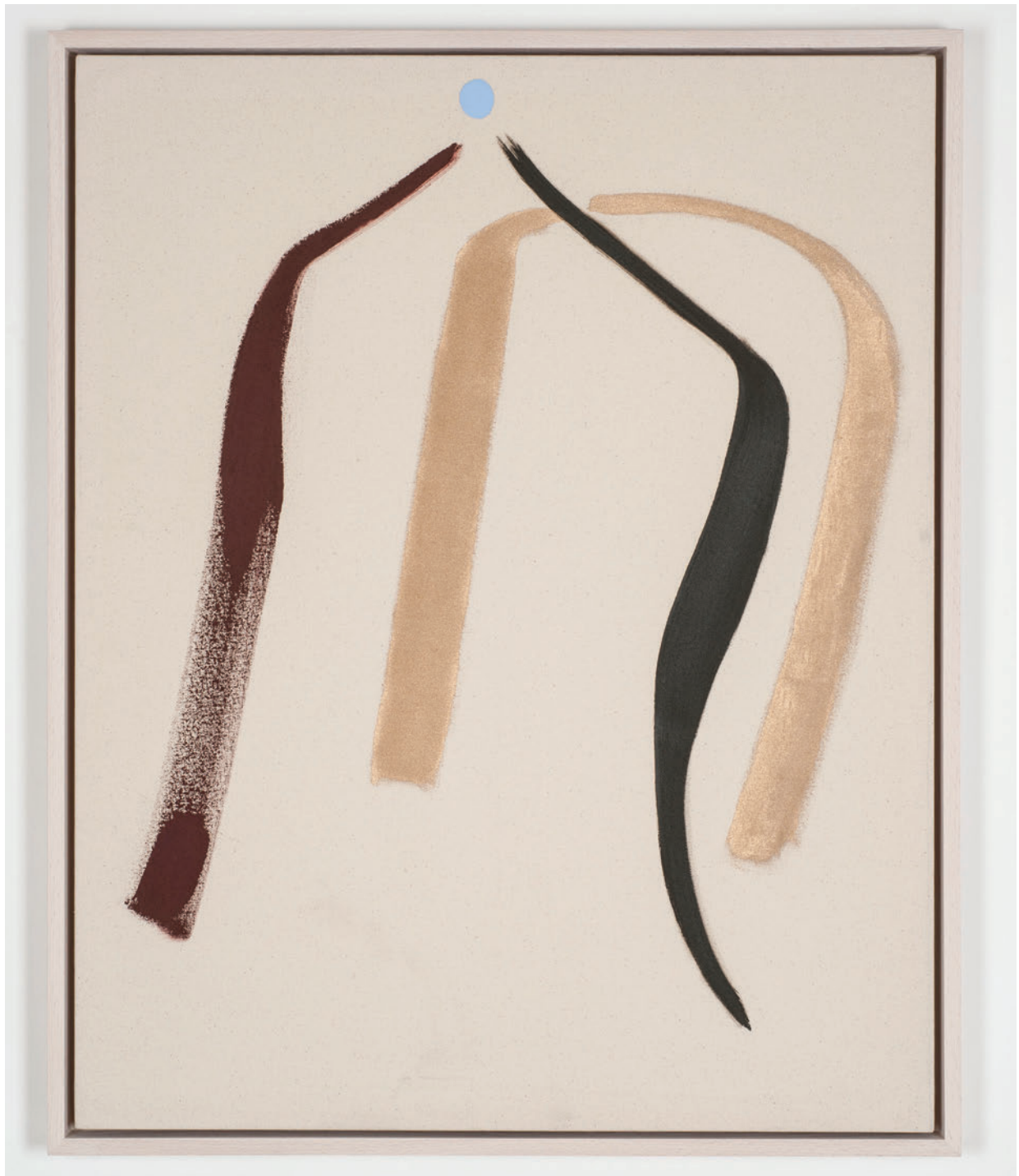
Mason Saltarrelli Observation of an eclipse, 2019 Oil on canvas 80 x 65 cm (framed)