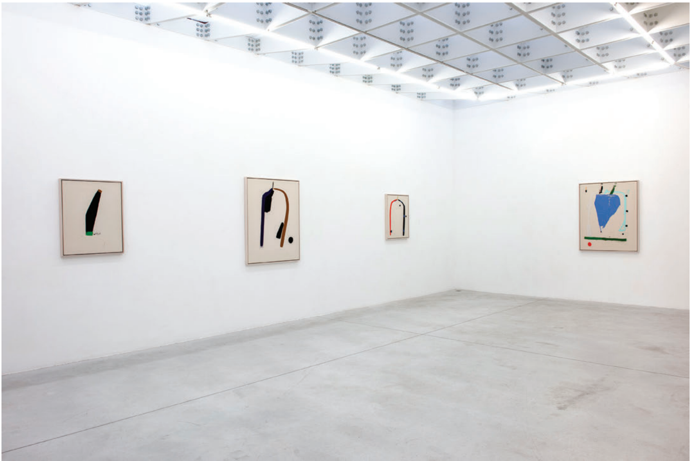
Exhibition view, Four Seasons In One Day , Meessen De Clercq, 2019