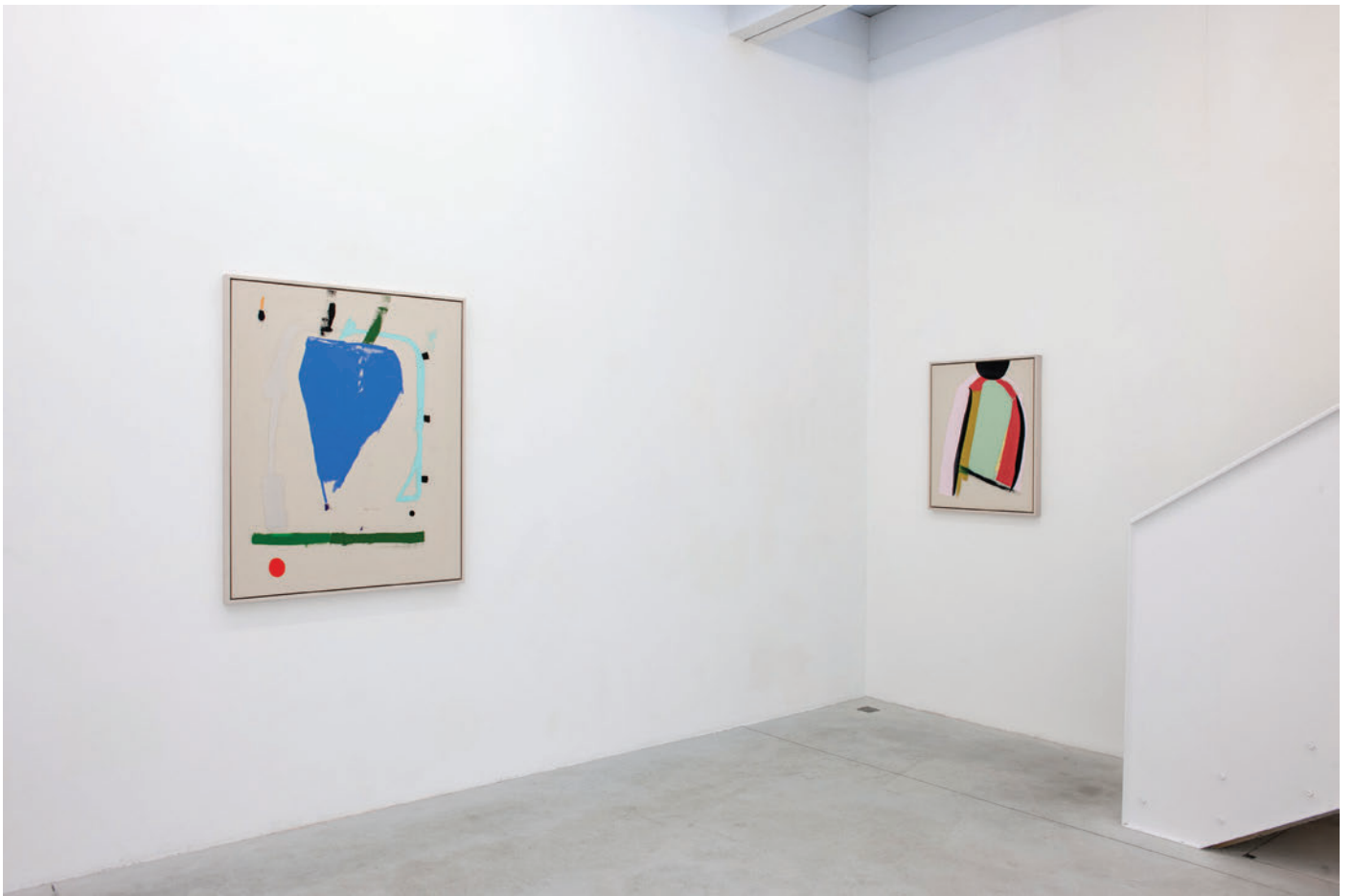
Exhibition view, Four Seasons In One Day , Meessen De Clercq, 2019