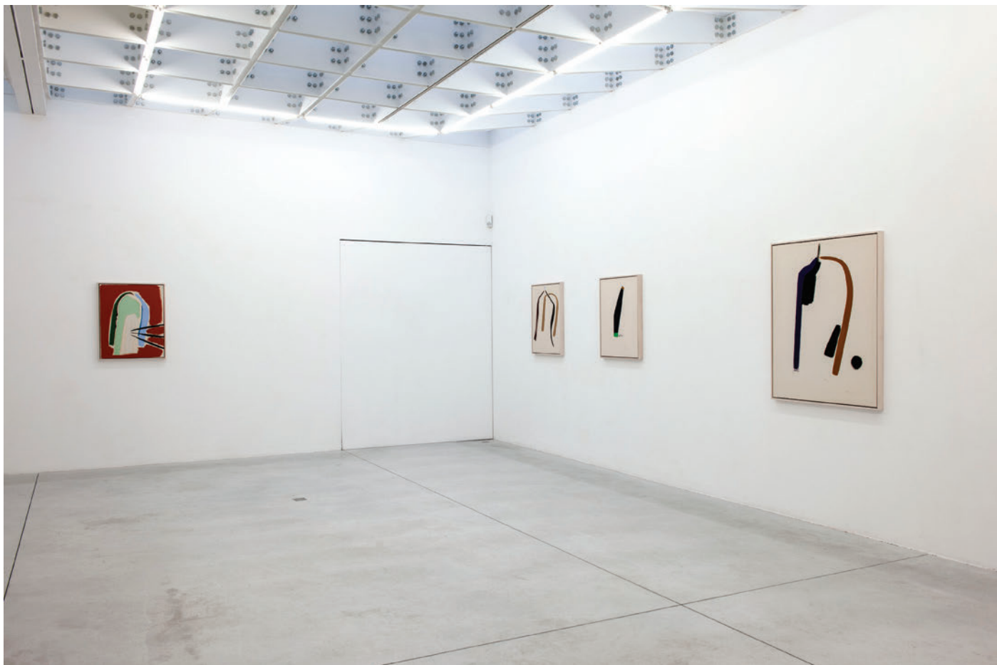
Exhibition view, Four Seasons In One Day , Meessen De Clercq, 2019