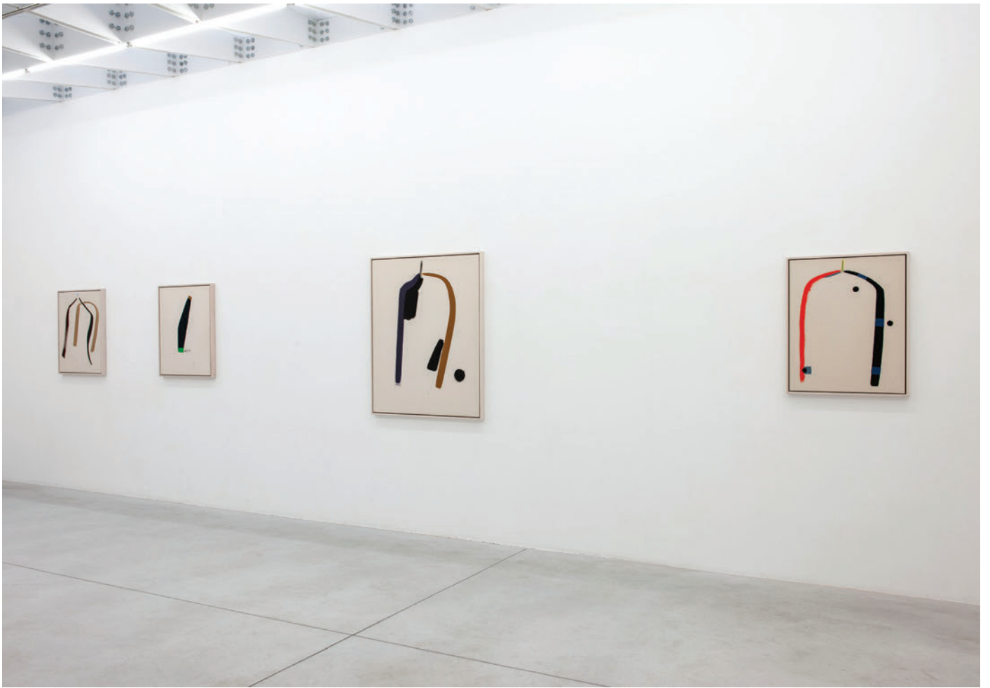
Exhibition view, Four Seasons In One Day , Meessen De Clercq, 2019