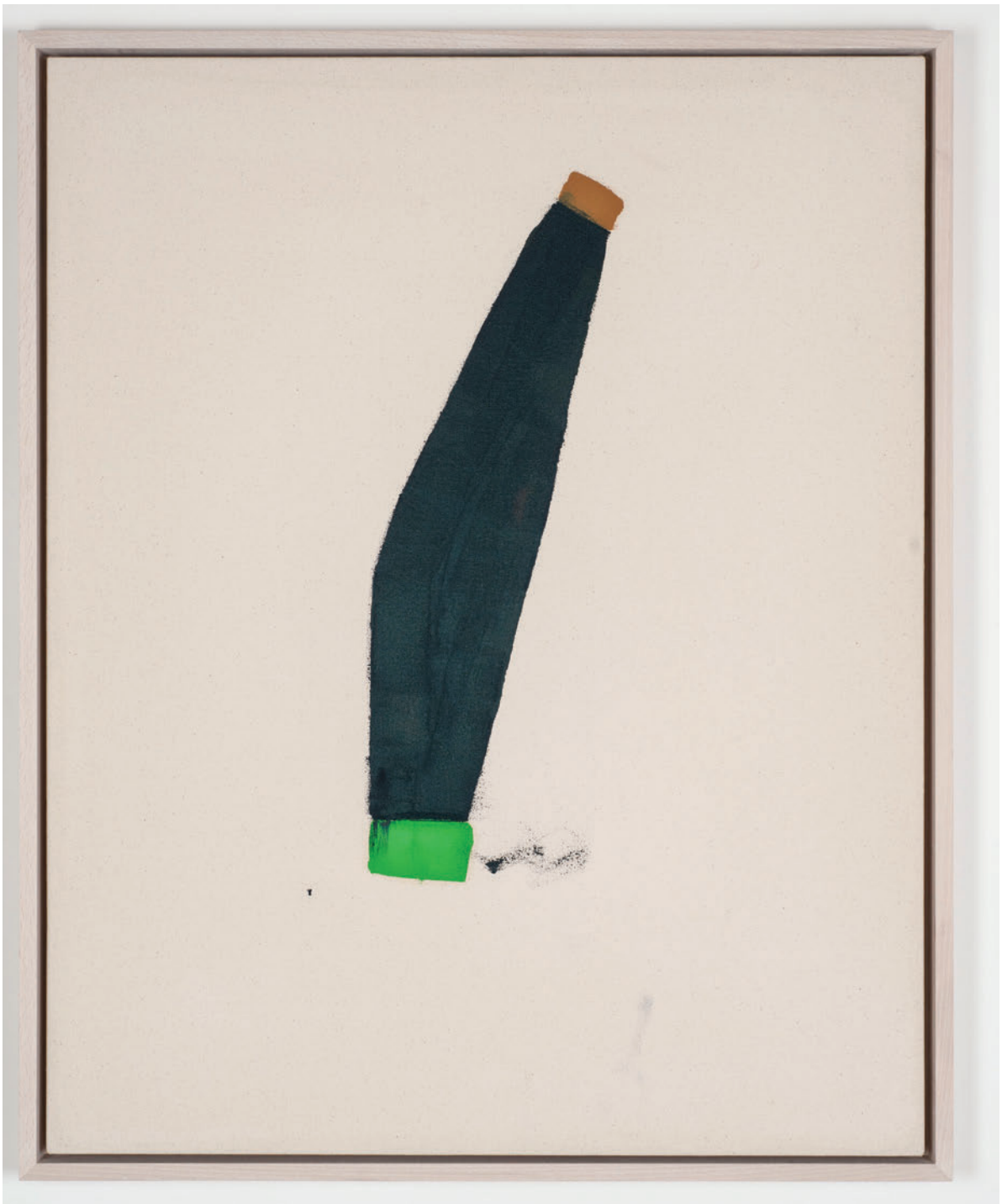
Mason Saltarrelli Narrative through song , 2019 Oil on canvas 80 x 65 cm (framed)