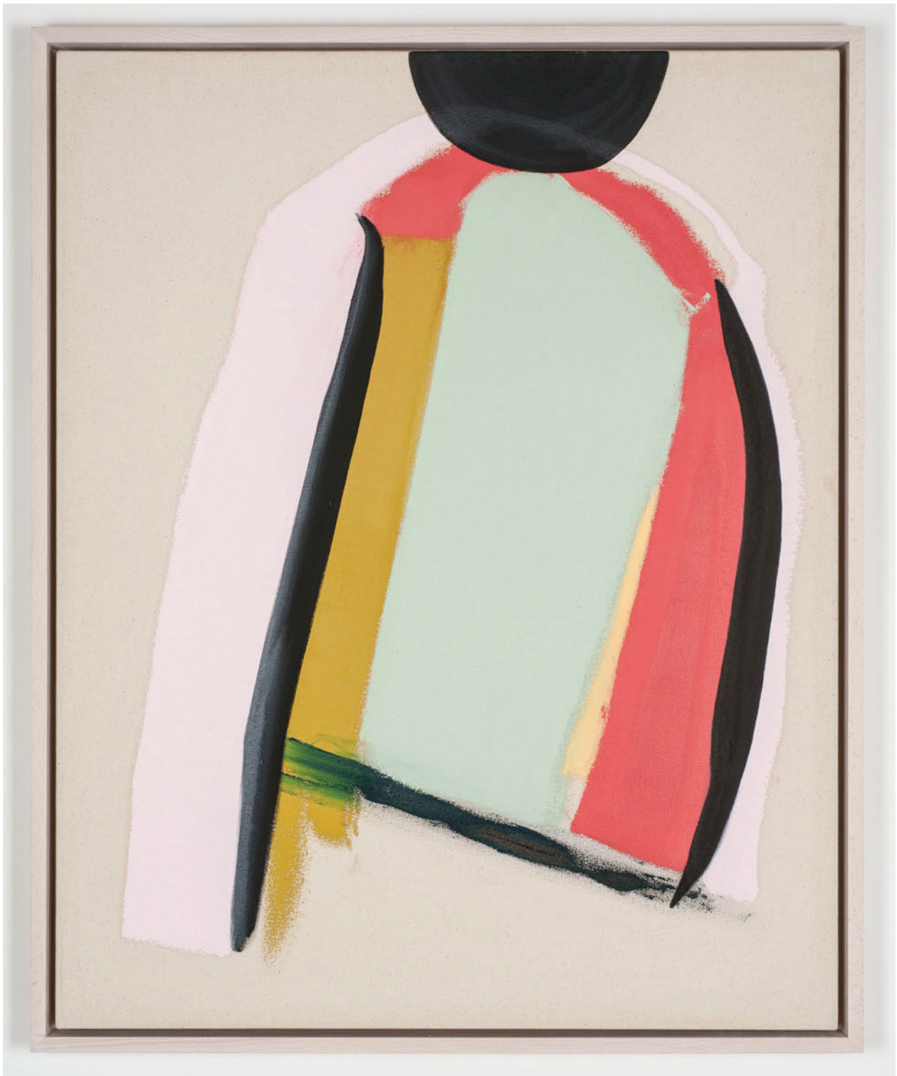
Mason Saltarrelli Leaves leaving, Fall, 2019 Oil on canvas 80 x 65 cm (framed)