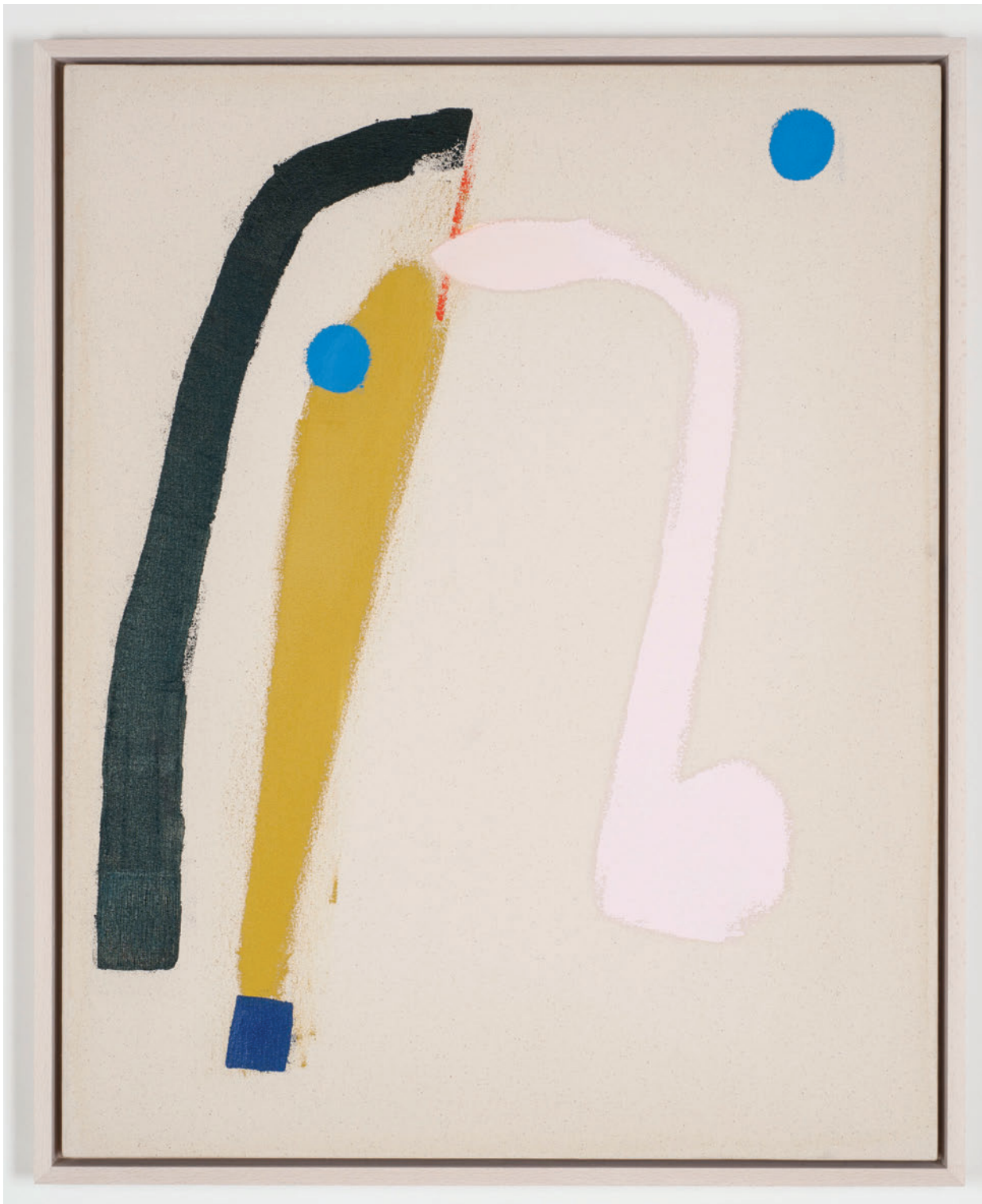
Mason Saltarrelli Opera singer singing , 2019 Oil on canvas 80 x 65 cm (framed)